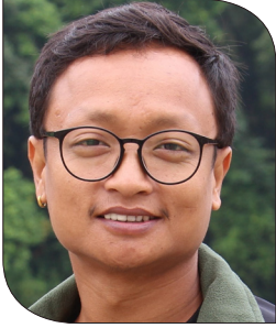
बिशाल राना मगर

नेपाली समाजको विकाससँगै ऍचोपैचो, पर्मा, सापटी, गुठीजस्ता अभ्यासले समाजमा एकलाई अष्टेरो पर्दा अर्कोले सहयोग गर्ने संस्कार छ। नेपाली समाजको आधुनिकीकरणसँगै केही सामाजिक अभ्यासमा परिवर्तन भने भइरहेका छन्। तथापि, नेपाली समाजमा एकलाई दुःख पर्दा अर्कोले सहयोग गर्ने परम्परा हराइसकेको छैन।